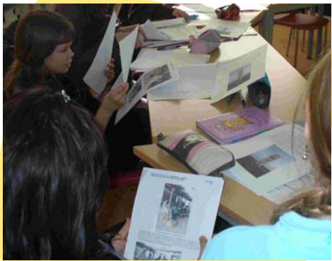
Même situation..., à Crest !