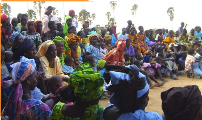
MOBILISATION SOCIALE A GANGUEL SOULÉ

La première réunion avec les chefs de villages, les notables, les représentants de la religion, des infirmiers chefs de postes de santé permet de présenter les villages du Dandé Mayo de Diolol et l'ADMS et de mesurer la motivation des responsables d'ADD ainsi que leur mobilisation pour le