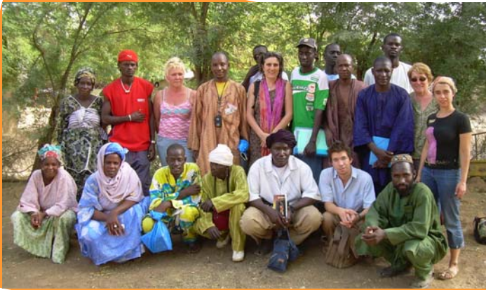
LES EQUIPES D'ADD ET D'ADMS

VOILÀ 2 ANS QUE LES DEUX ASSOCIATIONS, L'ASSOCIATION DU DANDÉ MAYO DE DIOLO, ADD, ET L'ASSOCIATION DROMOISE MST SIDA, ADMS, OEUVRANT DANS LE CHAMP DE LA PRÉVENTION DU SIDA ONT DÉBUTÉ UN PARTENARIAT.