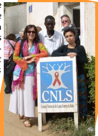
CONSEIL NATIONAL DE LUTTE CONTRE