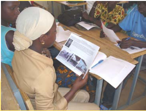
Élèves du collège de Thiempling découvrent les travaux du collège Revesz-Long de Crest échangeant depuis 3 ans

Pour un naturaliste, l'Afrique est avant tout le berceau hypothétique de l'humanité... L'« East side story » de Lucy. Oui mais le Sénégal n'est pas franchement à l'Est ! Alors une « West side story ». Arrivée à Da-